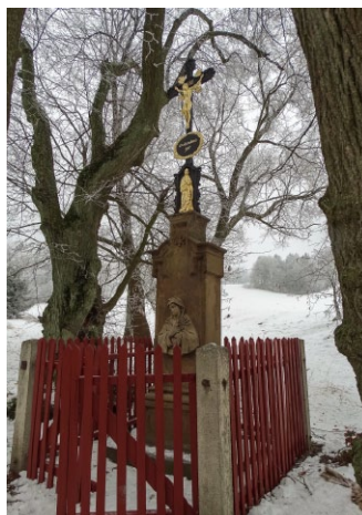
Kříž v Dolních Heřmanicích