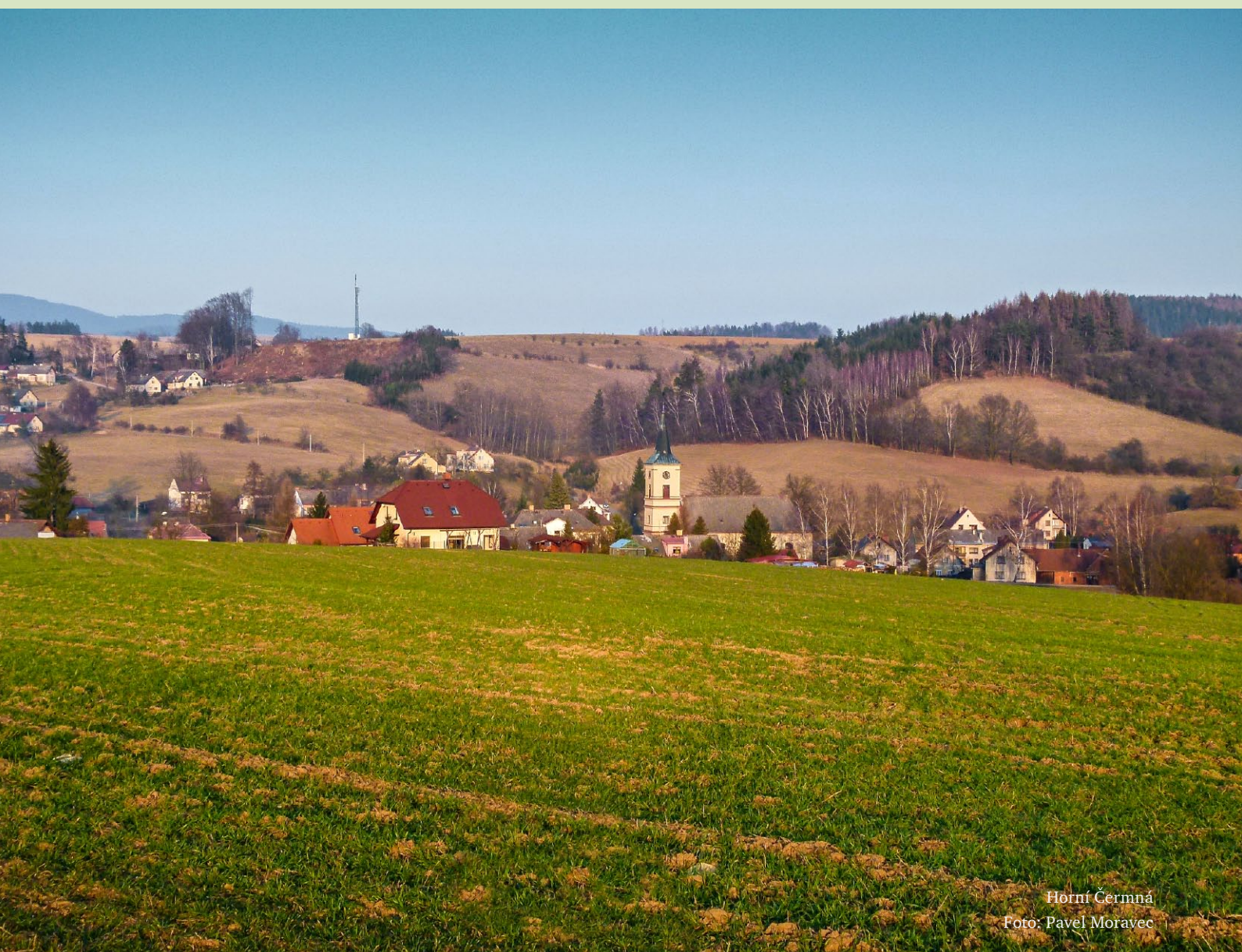
Horní Čermná