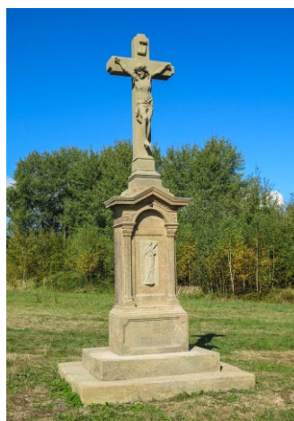
Kříž u kostela sv. Antonína Paduánského v Jakubovicích