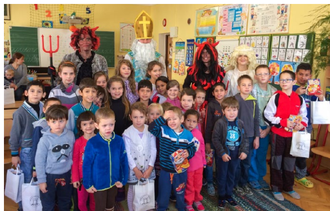
Foto: děti z mateřské a základní školy v Cotkytli

Rok se překlopil do svého konce a zaměstnanci našeho CSS se ve spolupráci se starosty obcí Dolní Čermná,