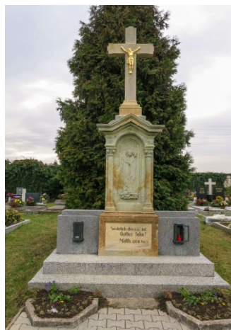
Kříž na hřbitově v Horním Třešňovci

V listopadu roku 2016 svazek ukončil projekt s názvem „Kulturní dědictví Severo-Lanškrounska 2016“, v rámci kterého byly opraveny drobné památky na území obcí Dolní Čermná – v místní části Jakubovice, Horní Heřmanice, Horní Třešňovec, Verměřovice a Výprachtice s celkovým rozpočtem 427 550 Kč.