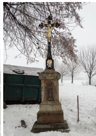
Kříž na Malé Straně ve Výprachticích