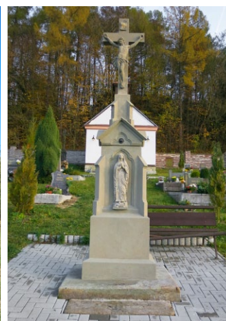
Kříž na hřbitově ve Verměřovicích