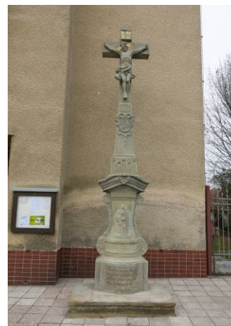
Kříž před kostelem ve Verměřovicích